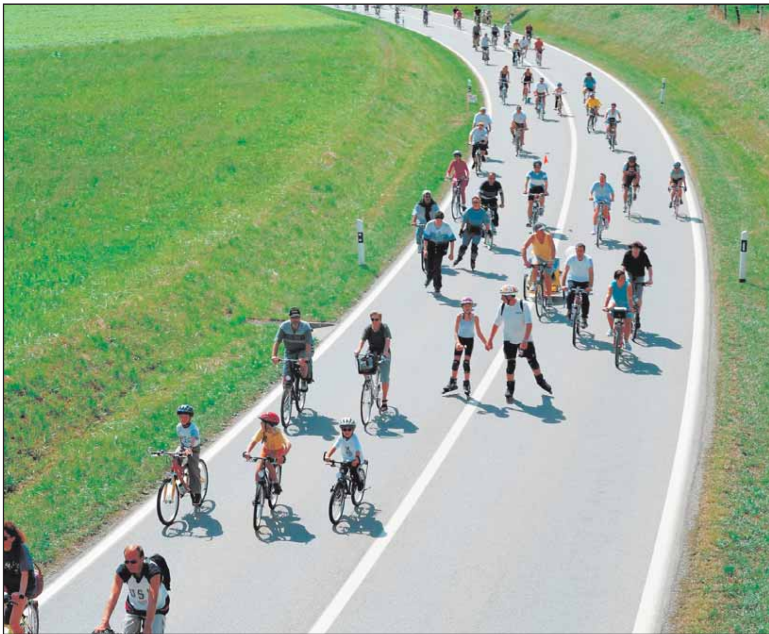
Lors des Slow Up, les routes sont occupées sans bruit par les piétons et autres cyclistes, comme l'année passée près de Morat.

Et le plus grand nombre, cela représente combien plus précisément? «On ne veut pas atteindre les 80 000 personnes qui ont fait le tour du lac de Morat l'année passée. Si 15 000 à 20 000 personnes se retrouvent entre Sion et Sierre ce jour-là, on sera content pour une première...» Les aléas de la météo pourraient transformer ses pronostics en véritable loterie. En cas de pluie comme en cas de beau temps. «De toute façon, nous devons être capables de gérer le double de nos prévisions», conclut-il. Le gros point noir que les organisateurs s'attendent à devoir gérer, c'est paradoxalement le trafic automobile engendré par la Slow Up. «Lorsque j'ai été l'année passée à celle de la Gruyère, il y avait un bouchon de vingt-cinq minutes pour atteindre les parkings», raconte Marianne Bruchez. La solution valaisanne, avec deux grandes portes d'entrée comme Sierre et Sion, devrait permettre de diluer les flux. «Et on espère que les participants utiliseront d'abord les transports en commun.»