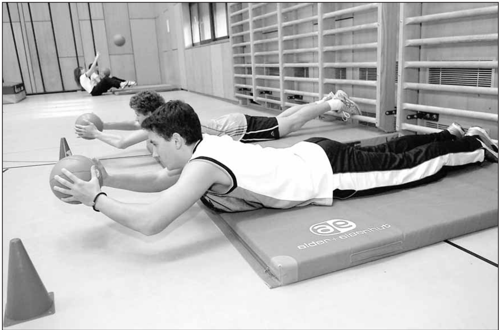
Seules des activités physiques ponctuelles sont actuellement proposées aux apprenants valaisans. BITTEL

SPORT ET APPRENANTS ► Contrairement au collège, aucun cours de gym régulier n'est dispensé dans nos centres professionnels. «Mais cette situation devrait bientôt changer», assure le chef de service. Le point à l'occasion de l'action Slow Up prévue le 27 mai entre Sion et Sierre.